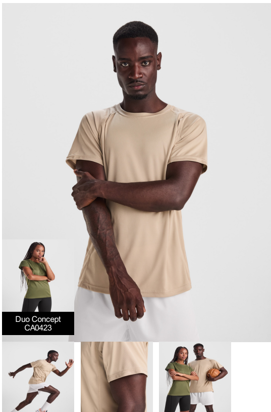
Duo Concept CA0423